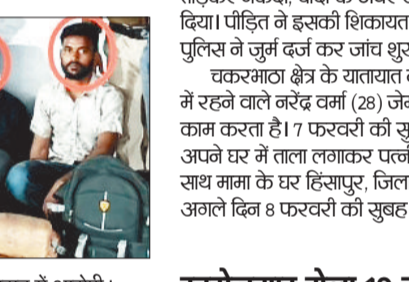
आरपीएफ के हिरासत में आरोपी।

हरिभूमि न्यूज ►► बिलासपुर आरपीएफ की टीम ने पेट्रोलिंग के दौरान गांजा तस्क़री करने वाले आरोपी को पकड़ा है, जिसके पास से 17 किलो से अधिक गांजा जब्त करने के बाद पुलिस को अग्रिम कार्रवाई के लिए सुपुर्द कर दिया गया है।