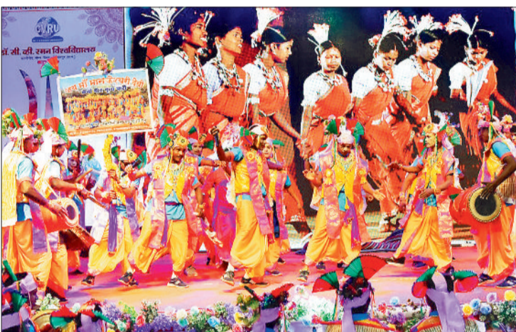
सांस्कृतिक कार्यक्रम की प्रस्तुति देते कलाकार।