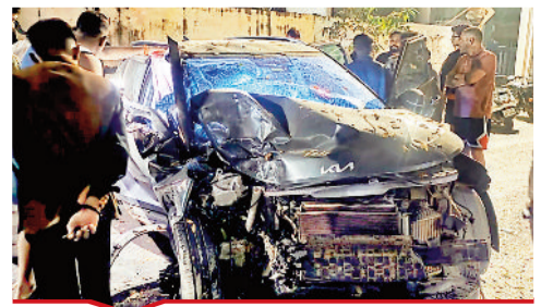
शुक्रवार की सुबह पुलिस लाइन रोड पर एक कार पेड़ से टकराकर क्षतिग्रस्त हो गई, इसमें सवार दो लोग घायल हो गए।

बिल्हा | मस्तूरी | तखतपुर | मुंगेली | कोटा | लोरमी | सरगांव | पेंड़ा | बेलतरा | रतनपुर | पथरिया